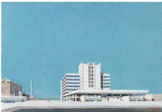
長野市庁舎パース