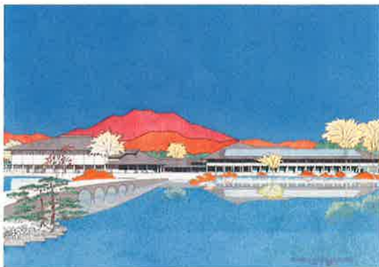
長野市立博物館パース